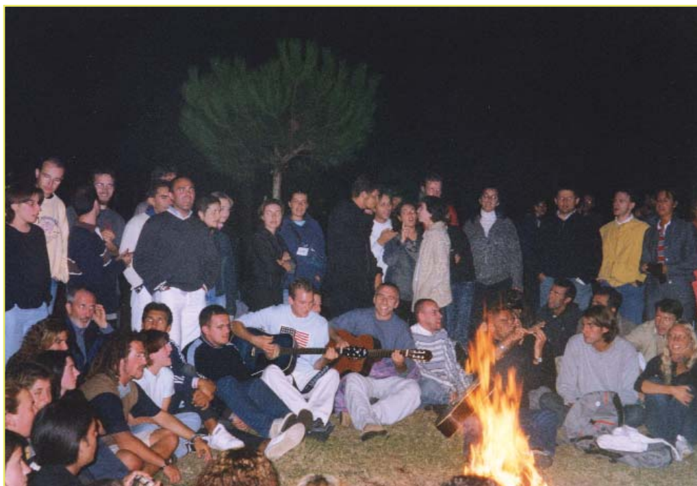
Il falò. Momento aggregante del Forum. Nella serata del venerdì anche il cantautore Cristiano De Andrè vi ha partecipato.

Uno spazio particolare è stato il falò notturno, momento assolutamente libero, posto in coda alle attività serali, finalizzato a "tirare tardi" cantando insieme. Fin dalla prima sera, i partecipanti si sono organizzati in modo da garantire musica, fuoco, generi di conforto. Il falò è stato vissuto da persone di tutte le età accomunate dalla conoscenza delle canzoni e dalla disponibilità di mettersi in gioco.